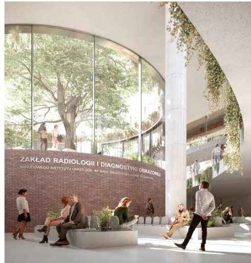
WIDOK NA WNIĘTRZE HOLLU GŁÓWNEGO W BUDYNKU BK2 Z POZIOMU -1