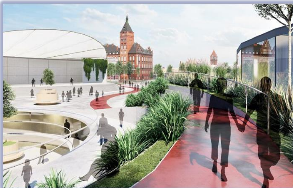
Wizualizacja koncepcji zagospodarowania i rewitalizacji obszaru w granicach ul. Wrocławskiej, Strzody i Dworcowej. Autor: inż. arch. Paula Jaworek