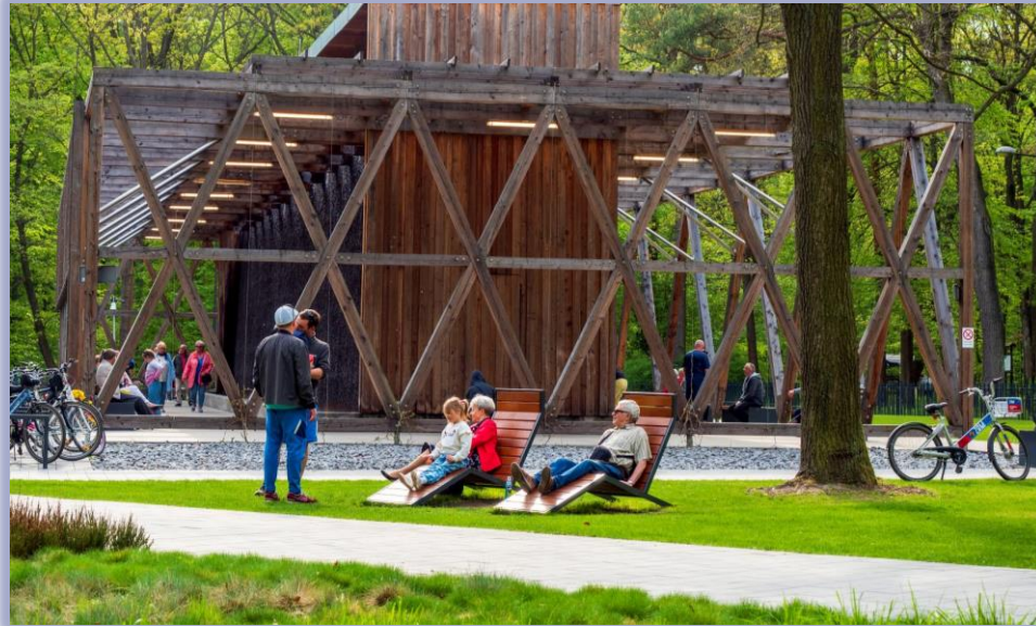
Fot. G. Oźga