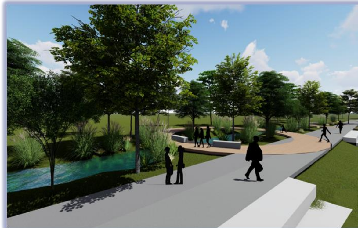
Rewitalizacja terenów wzdłuż rzeki Kłodnicy. Autorki: inż. arch. Wiktoria Anczykowska, inż. arch. Marta Śpiewok