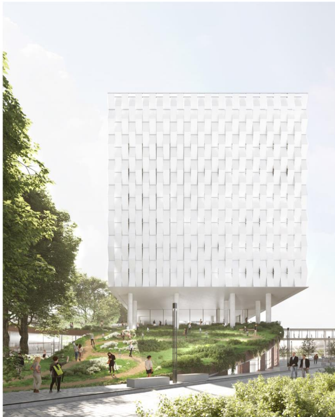
WIDOK NA BUDYNEK BK2 OD STRONY WSCHODNIEJ