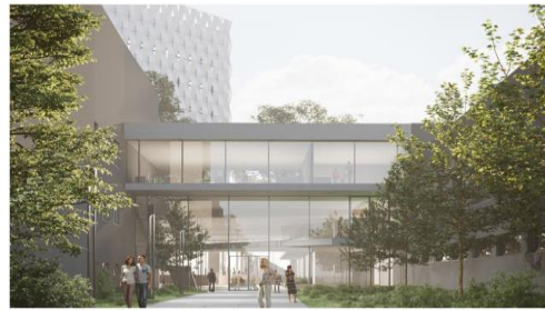
WIDOK NA POLUDNIOWE WEJSIE DO BUDYNKU BK2