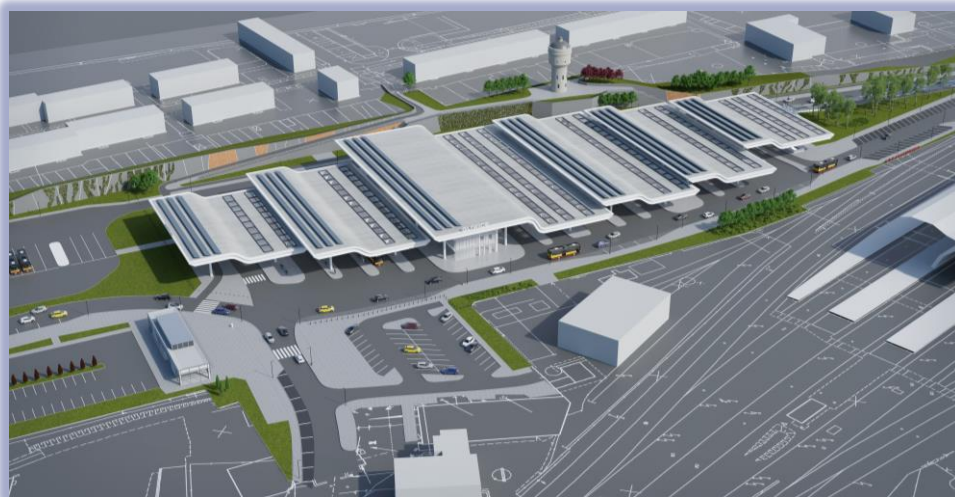
Wiz. Mostostal Zabrze Biprohut